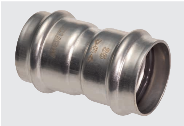
>B< Press Inox Kontur 15–54 mm (B-Kontur)