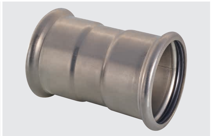
>B< Press Inox Kontur 76–108 mm (M-Kontur)